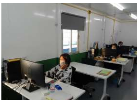
รูปที่ 28 คนสวมหน้ากากอนามัย