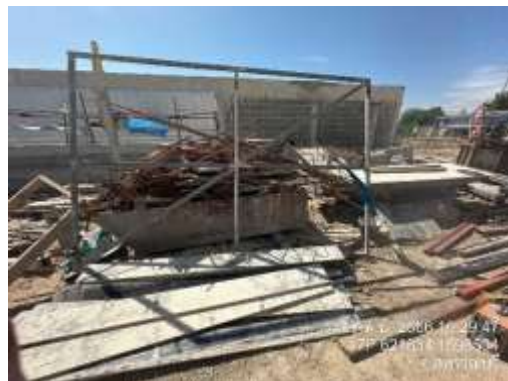
รูปที่ 2 พื้นที่กองเก็บวัสดุ (ปัจจุบันได้ทำการรื้อถอนเรียบร้อยแล้ว)