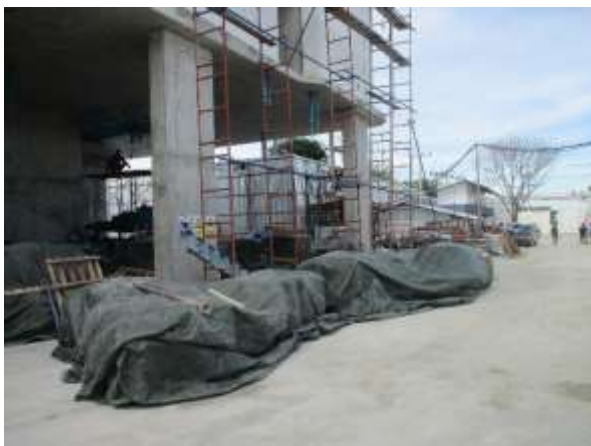
รูปที่ 50 มังรำน (ปัจจุบันได้ทำการรื้อถอนเรียบร้อยแล้ว)