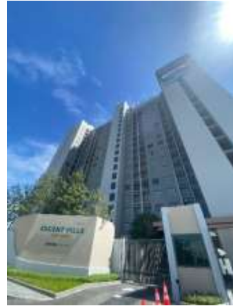
รูปที่ 53 สภาพนางานปัจจุบัน (เดือนมิถุนายน 2567)