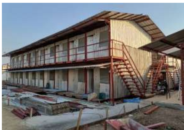
รูปที่ 26 บ้านพักคนงาน (ปัจจุบันได้ทำการรื้อถอนเรียบร้อยแล้ว)