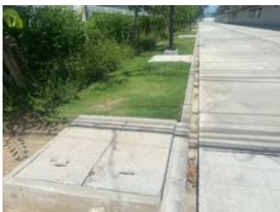
รูปที่ 16 รางระบายน้ำถาวร