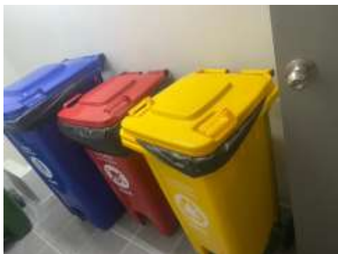
รูปที่ 43 ถังรองรับมูลฝอย