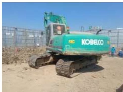
รูปที่ 38 ป้ายสัญญาณจราจร/ป้ายเตือนขณะทำงาน (ปัจจุบันได้ทำการรื้อถอนเรียบร้อยแล้ว)