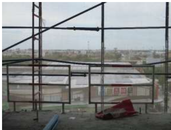
รูปที่ 51 รววกันตค (ปัจจุบันได้ทำการรื้อถอนเรียบร้อยแล้ว)