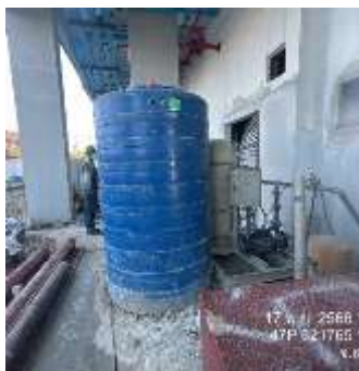
รูปที่ 15 ถังสำรองน้ำใช้ (ปัจจุบันได้ทำการรื้อถอนเรียบร้อยแล้ว)