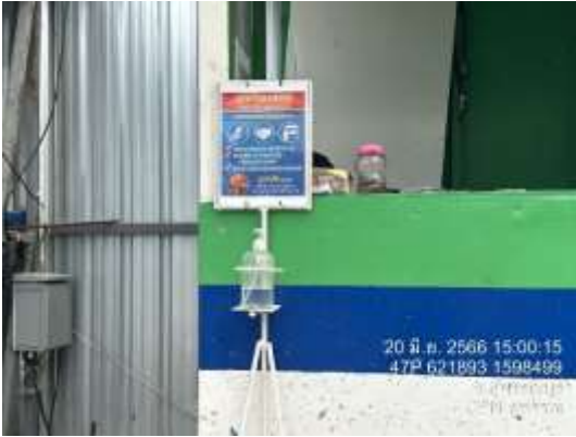
รูปที่ 46 จัดคัดกรอง (ปัจจุบันได้ทำการรื้อถอนเรียบร้อยแล้ว)