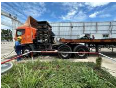
รูปที่ 8 พื้นที่จอดรถ