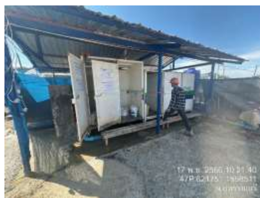
รูปที่ 12 ห้องน้ำห้องส้วม /เจ้าหน้าที่ทำความสะอาดห้องน้ำห้องส้วม (ปัจจุบันได้ทำการรื้อถอนเรียบร้อยแล้ว)