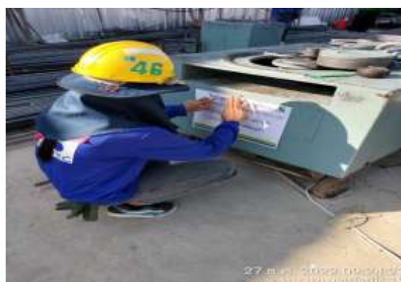
รูปที่ 34 ป้ายเตือน (ปัจจุบันได้ทำการรื้อถอนเรียบร้อยแล้ว)