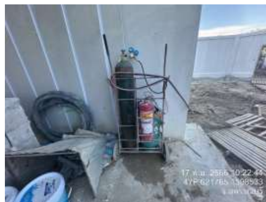
รูปที่ 17 ถังดับเพลิงเคมีชนิดมือถือ