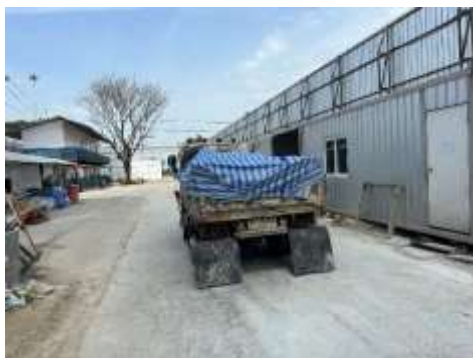
รูปที่ 7 ปิดคลุมรถบรรทุก