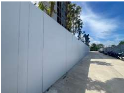
รูปที่ 1 รั้วชั่วคราวเป็นรั้ว Metal Sheet สูง 6 เมตร ปัจจุบันเป็นรั้วถาวร