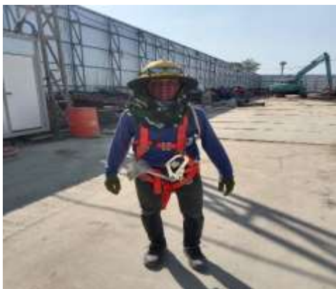
รูปที่ 23 อุปกรณ์ป้องกันอันตรายส่วนบุคคล