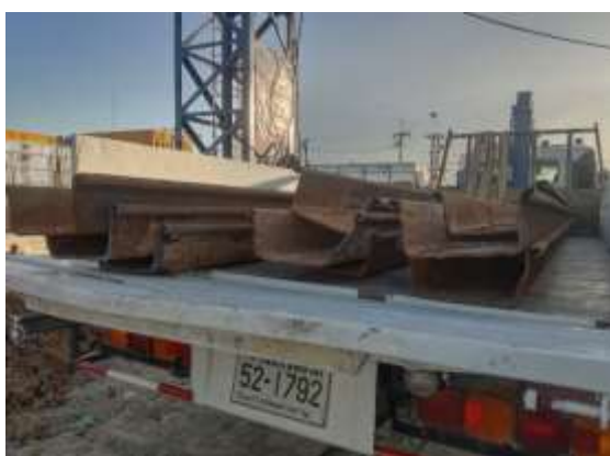
รูปที่ 11 Sheet Pile (ปัจจุบันได้ทำการรื้อถอนเรียบร้อยแล้ว)