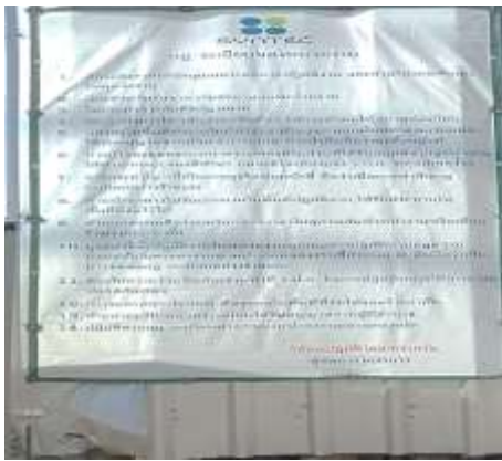
รูปที่ 20 กฎระเบียบการก่อสร้าง (ปัจจุบันได้ทำการรื้อถอนเรียบร้อยแล้ว)