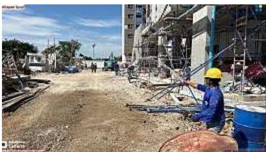
รูปที่ 3 ฉีดพรมน้ำบริเวณพื้นที่โครงการ