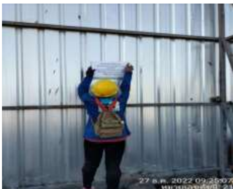
รูปที่ 35 ป้ายห้ามเผาขยะ และวัสดุก่อสร้างภายในโครงการ (ปัจจุบันได้ทำการรื้อถอนเรียบร้อยแล้ว)