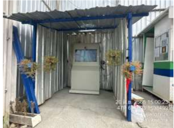
รูปที่ 47 เครื่องสแกนหน้าเข้าทำงาน (ปัจจุบันได้ทำการรื้อถอนเรียบร้อยแล้ว)