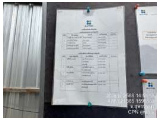
รูปที่ 42 หมายเลขโทรศัพท์ของสถานดับเพลิง สถานี ตำรวจ และโรงพยาบาล (ปัจจุบันได้ทำการรื้อถอนเรียบร้อยแล้ว)