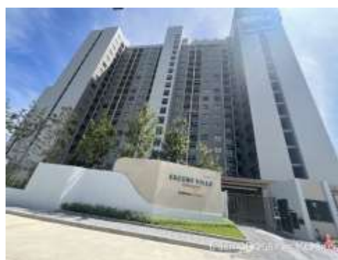
รูปที่ 53 สภาพหน้างานปัจจุบัน (เดือนมิถุนายน 2567)