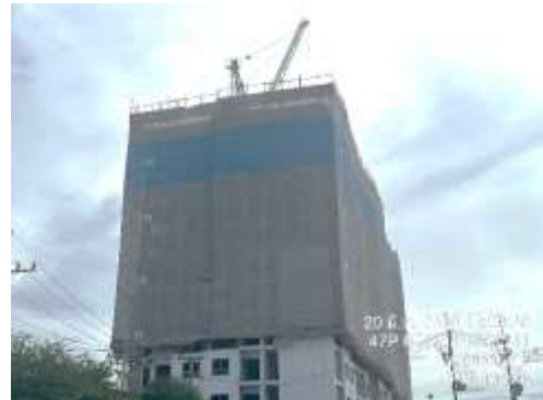
รูปที่ 48 Mesh Sheet คลุมอาคาร