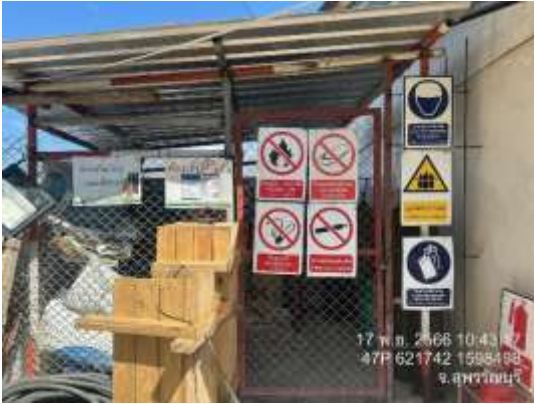
รูปที่ 18 สถานที่สำหรับเก็บเชื้อเพลิงและวัสดุไวไฟต่างๆ (ปัจจุบันได้ทำการรื้อถอนเรียบร้อยแล้ว)