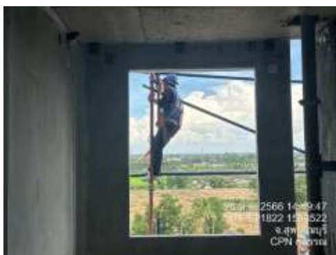
รูปที่ 45 คนงานใส่อุปกรณ์ป้องกันอันตรายส่วนบุคคลขณะปฏิบัติงาน