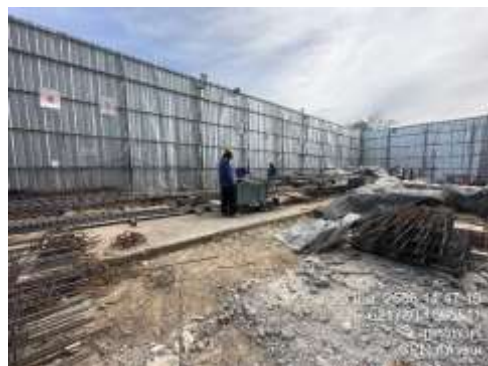
รูปที่ 44 พื้นที่สำหรับตัดเหล็ก (ปัจจุบันได้ทำการรื้อถอนเรียบร้อยแล้ว)