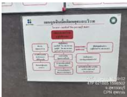
รูปที่ 52 แผนฉุกเฉิน