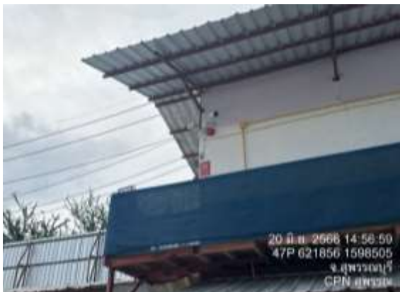
รูปที่ 22 CCTV (ปัจจุบันได้ทำการรื้อถอนเรียบร้อยแล้ว)