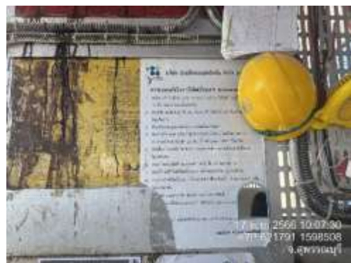
รูปที่ 49 ลิฟต์ขนส่งวัสดุ (ปัจจุบันได้ทำการรื้อถอนเรียบร้อยแล้ว)