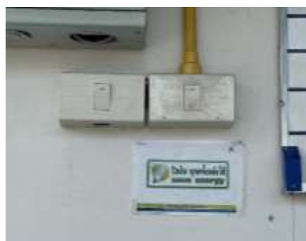
รูปที่ 40 ป้ายประหยัดน้ำ / ประหยัดไฟฟ้า (ปัจจุบันได้ทำการรื้อถอนเรียบร้อยแล้ว)