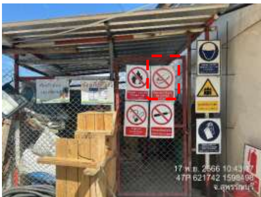
รูปที่ 41 ป้ายห้ามสูบบุหรี่ (ปัจจุบันได้ทำการรื้อถอนเรียบร้อยแล้ว)