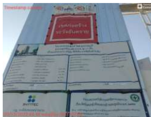
รูปที่ 32 ป้ายเตือนเขตก่อสร้าง (ปัจจุบันได้ทำการรื้อถอนเรียบร้อยแล้ว)