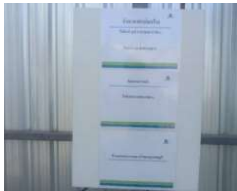
รูปที่ 36 ป้ายกำหนดช่วงเวลาในการทำงาน (ปัจจุบันได้ทำการรื้อถอนเรียบร้อยแล้ว)