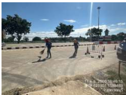
รูปที่ 5 พนักงานทำความสะอาดพื้นที่ก่อสร้าง/กวาดเศษดิน ทราย