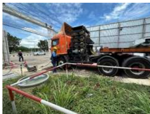
รูปที่ 6 ล้างล้อรถ/จุดล้างล้อ (ปัจจุบันได้ทำการรื้อถอนเรียบร้อยแล้ว)