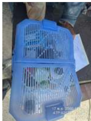
รูปที่ 24 กล่องยาปฐุมพยาบาล/ห้องพยาบาล