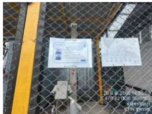
รูปที่ 14 เจ้าหน้าที่ตรวจสอบระบบสายไฟฟ้า และ อุปกรณ์ไฟฟ้าต่างๆ