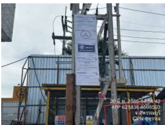
รูปที่ 33 ป้ายจำกัดความเร็วไม่เกิน 20 กม./ชม. (ปัจจุบันได้ทำการรื้อถอนเรียบร้อยแล้ว)