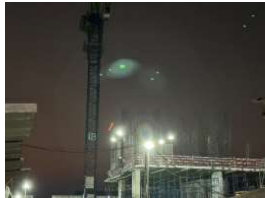
รูปที่ 21 ไฟฟ้าส่องสว่าง (ปัจจุบันได้ทำการรื้อถอนเรียบร้อยแล้ว)