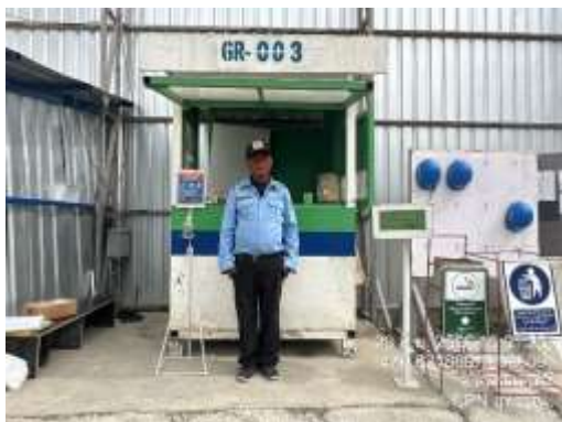
รูปที่ 13 เจ้าหน้าที่รักษาความปลอดภัย (รปภ.) (ปัจจุบันได้ทำการรื้อถอนเรียบร้อยแล้ว)