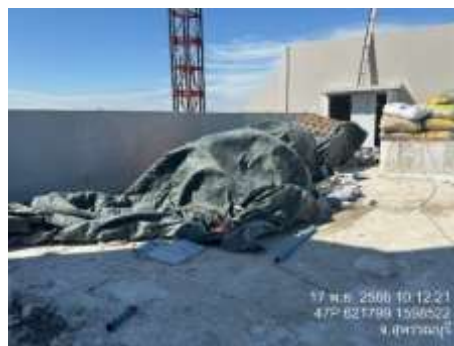
รูปที่ 4 ปิดคลุมกองวัสดุ (ปัจจุบันได้ทำการรื้อถอนเรียบร้อยแล้ว)