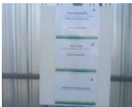
รูปที่ 39 ป้ายกำหนดช่วงเวลาในการขนส่งวัสดุอุปกรณ์ ก่อสร้างในช่วงเวลา 10.00 - 15.00 น. (ปัจจุบันได้ทำการรื้อถอนเรียบร้อยแล้ว)