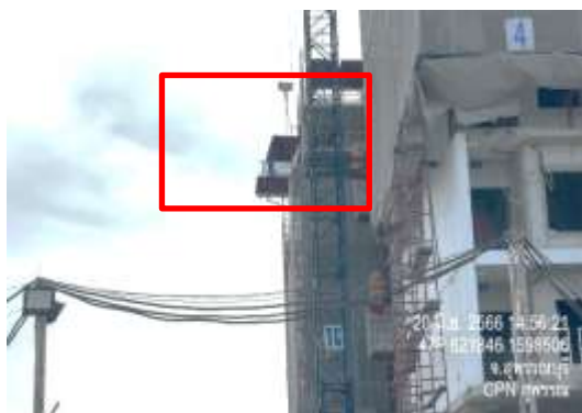
รูปที่ 9 ควบคุมการเคลื่อนย้ายวัสดุอุปกรณ์ก่อสร้างไม่ให้เสี่ยงต้งรถชนข้างเคียง