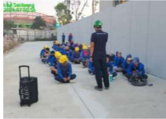
รูปที่ 19 กิจกรรม Morning Talk/Safety Talk