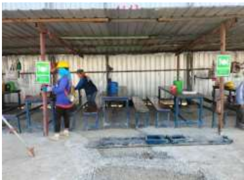
รูปที่ 29 พื้นที่สำหรับทานอาหาร (ปัจจุบันได้ทำการรื้อถอนเรียบร้อยแล้ว)