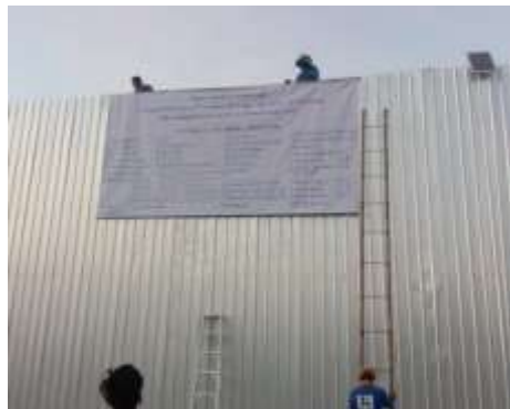
รูปที่ 30 ป้ายรายละเอียดโครงการ (ปัจจุบันได้ทำการรื้อถอนเรียบร้อยแล้ว)