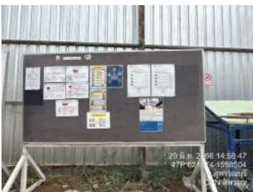
รูปที่ 31 มาตรการป้องกันฯ (ปัจจุบันได้ทำการรื้อถอนเรียบร้อยแล้ว)