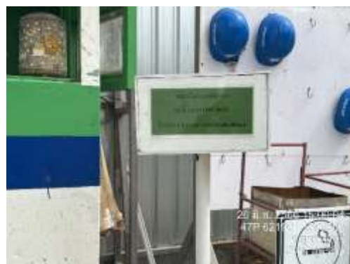
รูปที่ 10 กล่องรับเรื่องร้องเรียน (ปัจจุบันได้ทำการรื้อถอนเรียบร้อยแล้ว)