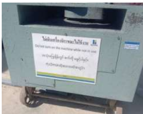
รูปที่ 37 ป้ายกรุณาดับเครื่องยนต์ (ปัจจุบันได้ทำการรื้อถอนเรียบร้อยแล้ว)